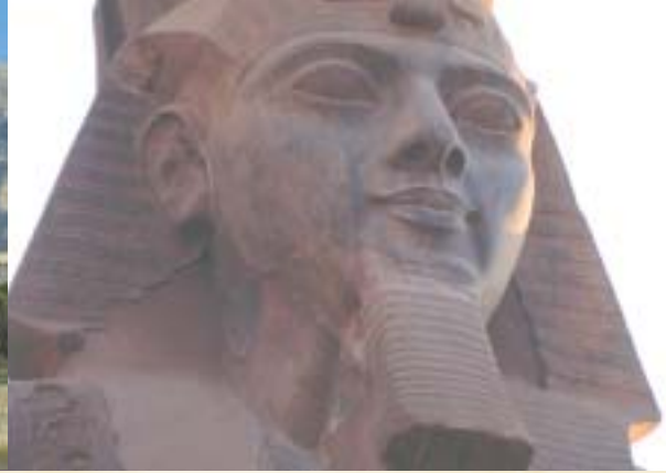
TAL DER KÖNIGE _ COLOSSI OF MEMMON