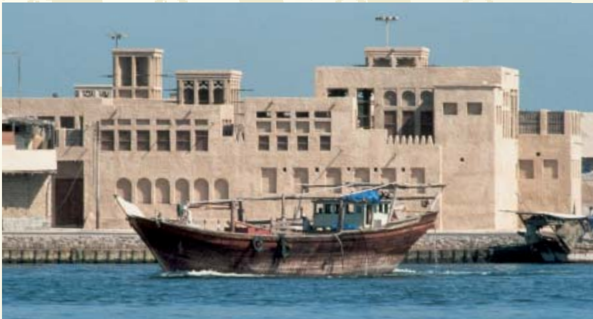
Das „Sheikh Saeed al Maktoum“-Haus

Während wir unseren letzten Abend im Morgenland feiern, werden die Koffer abgeholt und schon mal zum Flughafen gebracht. Später müssen Sie dann nur Ihr Gepäck identifizieren und Ihre Bordkarte entgegennehmen. Abschließend haben Sie dann noch Gelegenheit, am Dubai Airport die besten Duty-free-Shops der Welt zu durchstöbern und die allerletzten Weihnachtspresente zu besorgen.