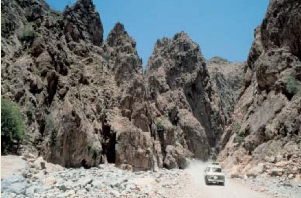
... und Felsenlandschaft auf dem Weg nach Hatta