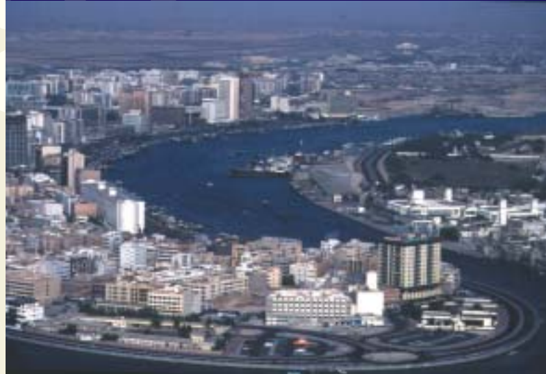
Der Dubai Creek

Das „Grand Hyatt Dubai“ ist das neueste Fünf-Sterne-Stadthotel in Dubai und auf Anhieb auch eines der schönsten. Direkt am Dubai Creek gelegen, besticht der imposante Bau einerseits durch seine außergewöhnliche Architektur und andererseits durch seine Lage: Die unmittelbare Nähe zum weltberühmten „Dubai Creek Golf & Yacht Club“ und zu den exklusiven Shopping-Malls ist perfekt für Golfer und für Shopper.