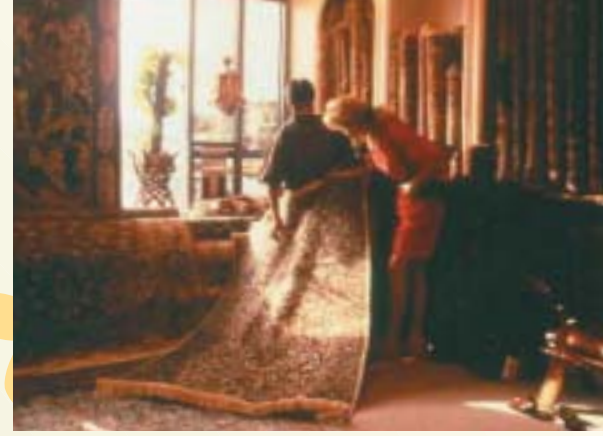
Das „Grand Hyatt Dubai“

Mit tuckernden „abras“, den berühmten Wassertaxis, überqueren wir den Creek, um zum alten Souk in Deira zu gelangen. Im Gewürz-Souk mischen sich die Gerüche von scharf bis süßlich mit einer Farbpalette von Ocker, Orange und Rot bis Dunkelbraun zu einem die Sinne betörenden Bild. Ebenso verführerisch präsentieren sich die schimmernden Auslagen im Gold-Souk. Unzählige Armreifen, Ringe und Halsketten zieren die Schaufenster und lassen dabei keinen Zweifel aufkommen: Hier ist alles Gold, was glänzt!