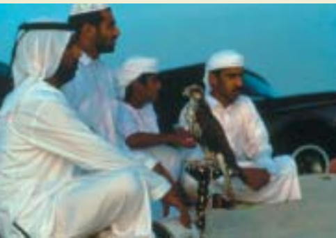
Besuch bei den Falknern