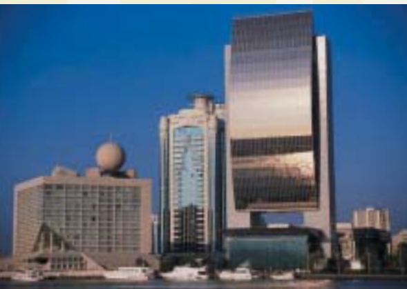
Die Skyline von Dubai am Dubai Creek

Und weiter geht es durch die Wüste und ihre endlos erscheinenden Dünen bis in den Sonnenuntergang hinein. Kurz bevor sich der Tag mit einem atemberaubenden Farbenspiel verabschiedet, erreichen wir die „Sunset Champagne Bar“, die wir nur für Sie in den Dünen aufbauen lassen. Mit einem prickelnden Glas Moët & Chandon in der Hand erleben Sie eine beeindruckende Falken-Show. Die Jagd mit abgerichteten Falken gehörte auch in Europa zu den Privilegien der Adligen – auf der Arabischen Halbinsel war diese königliche Freizeitbeschäftigung schon wesentlich früher