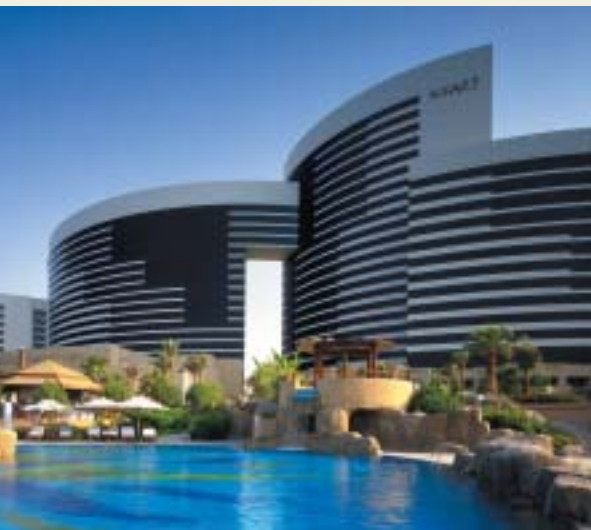
Das „Grand Hyatt Dubai“ – das neueste Fünf-Sterne-Stadthotel in Dubai

GMK bietet Ihnen diese exklusive Rundreise mit begrenzter Teilnehmerzahl zu einem Preis von 3.850,- € p. P. im Doppelzimmer an. Der Einzelzimmerzuschlag beträgt 680,- €. Im Reisepreis enthalten sind: Flüge Frankfurt/Dubai und zurück, innerdeutsche Verbindungsflüge, fünf Übernachtungen im Fünf-Sterne-Hotel, Vollpension inklusive Wein, Bier und Softdrinks zu den Mahlzeiten, Reisebetreuung durch Peter Bürger sowie das beschriebene exklusive Programm.