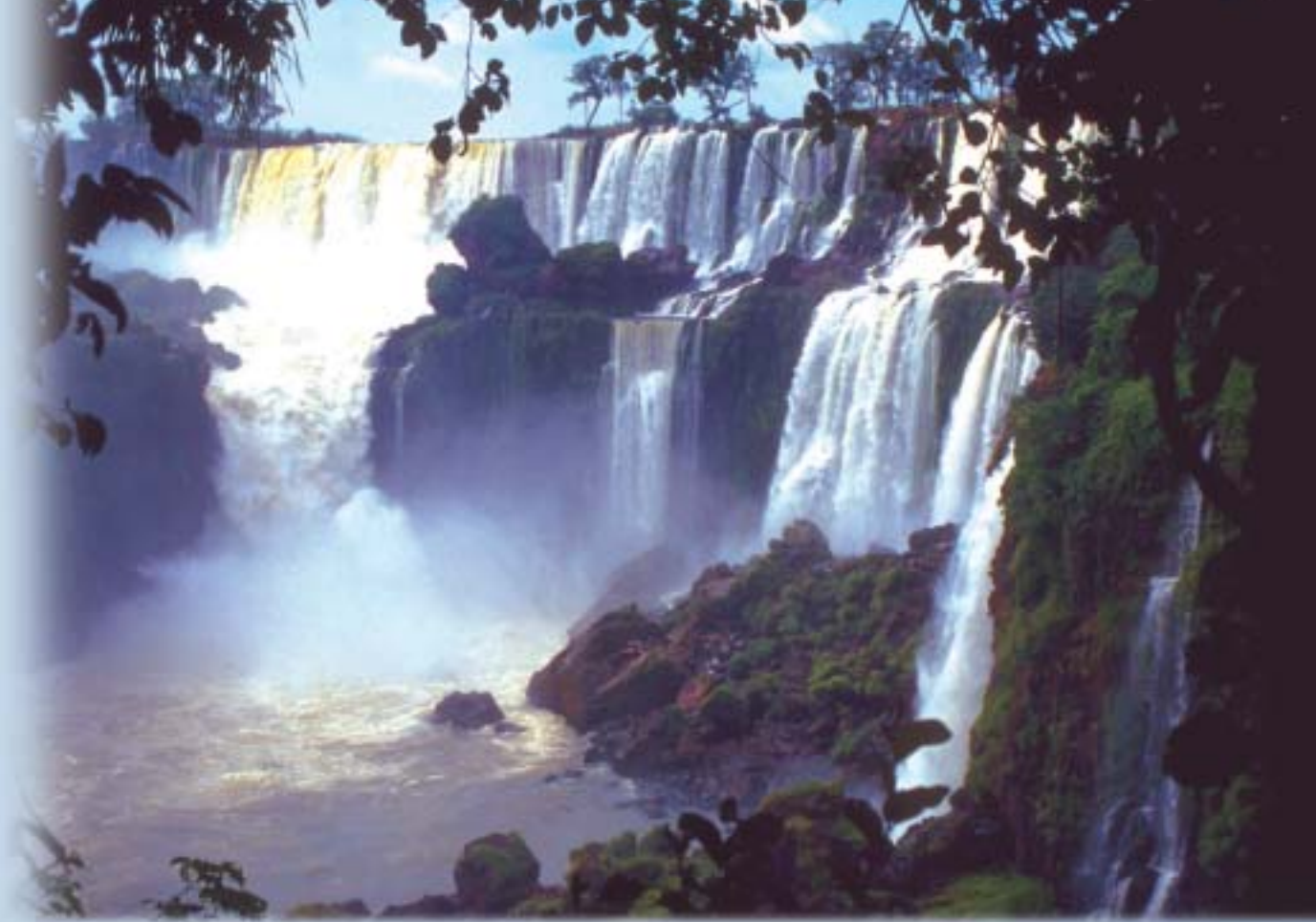
Die Fälle von Iguazu