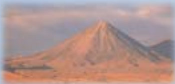
„Explora Hotel“ in der Atacama-Wüste