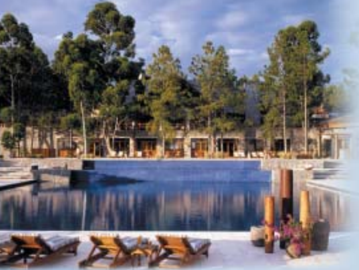
Uruguay, Hotel „Carmelo“